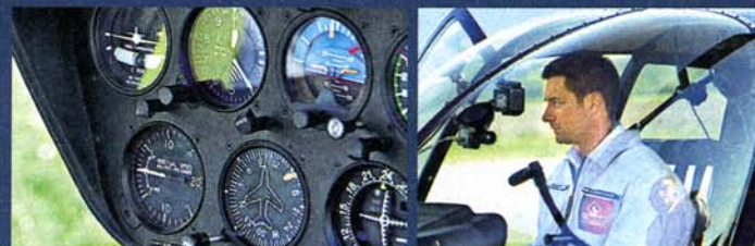
Um ein echter Pilot zu werden, müsste Marco Schreyll 45 Flugstunden und 80 Theoriestunden absolvieren. Kostenpunkt: etwa 25 000 Euro